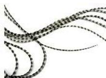
Blanco y Negro