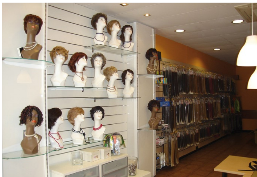
Imagen del showroom de La Central del Cabell en Manresa.

suministran artículos hechos a medida “con las características, la calidad y el color que nosotros queremos”, manifiesta Óscar Guisado.